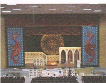
▲畢業典禮中興堂內場佈置

代表——火鳳凰；精緻的吊燈增添了中世紀歐洲的皇室貴族氣息；舞台上正中央的圓形百花草窗，以昏黃燈光的光全暗，由儀隊所帶來的旗陣與槍陣，氣勢磅礴地舞出開場劇，為今年的畢業典禮拉開序幕。譚光鼎校長一如往年粉墨登場，這次的扮裝主題搭配了教堂風格，以中世紀教宗現身。但不同的是，今年也是譚校長在附中任期的最後一年，他感性表示「將帶著附中校訓，與這屆高三同學們一起畢業」。 從天而降的畢業證書象徵了附子在城堡中的滿滿收穫，畢業生代表或擁抱校長、或搞笑、或嚴肅，美術班甚至還為校長畫上了腮紅，可是他們的心情卻相同：在搖籃曲生活的結束後，正蓄勢待發，迎接下一個挑戰。今年的畢業小組依舊把用不完的點子投入了VCR製作，舉凡智育獎、考場現形記一附中三年目睹之怪現狀、服務獎、不可能的任務——搶回被教官沒收之拖鞋……都是笑淚交織的甜蜜，都是附子三年的珍貴回憶。 每一年的畢業典禮都是附中盛事，都是每一屆大將的心血點滴，都是他校永遠模仿不來的創意與精髓，縱然承受了來自外部的壓力，附中人依舊堅持附中精神，將有限的資源發揮最大效用，帶給即將踏出藍色大門的附子們一個永生難忘的夢。 (記者 王滋鮮)