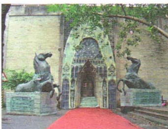
▲畢業典禮大門佈置

【本刊訊】二零零六年六月八日，附中大將一千餘名大將，昂首闊步進入附中，準備迎接高中生涯的最後一場盛宴——畢業典禮。 今年是附中第十一屆的創意畢業典，為了慶祝畢業典禮「十年有成」，本屆畢業典禮除了和往年相同，是由推甄申請提早入大學的高三學生製作外，和往年創意畢業典的不同處則是沒有以往特定的主題，僅取名為「獻藍·附將聖典」。今年的主題，就是附中。附聖生活為基調、中古時代的歐洲風情為協奏，譜出一首和往年不同的交響曲。 在中興堂門口迎接大將們的，是鐵灰色的駿馬；哥德式教堂高聳的尖頂暗示了接下來的冒險旅程。通過漆黑的長長地道後，映入眼簾的是一襲中世紀歐洲風情：偌大的禮堂變成迷宮，絢爛奪目的教堂彩繪玻璃、潺潺流水的水池與用椅子堆成的浮橋令人大為驚嘆；武士身上幾可亂真的盔甲與一旁繁複華麗的雕花棺木使人以為自己身在十字軍東征的年代。踏上通往二樓的階梯後，進入了附子們的創意畫廊：達文西的蒙娜麗莎、米勒的拾穗與孟克的吶喊皆以參雜了附堡色彩的畫面目示人，在莊重的氣氛中注入了一絲詼諧。 經過了重重探索與驚艷，中興堂內的主舞台更以無與倫比的奢華面目展現：兩旁巨型掛幅圖騰是附中精神的