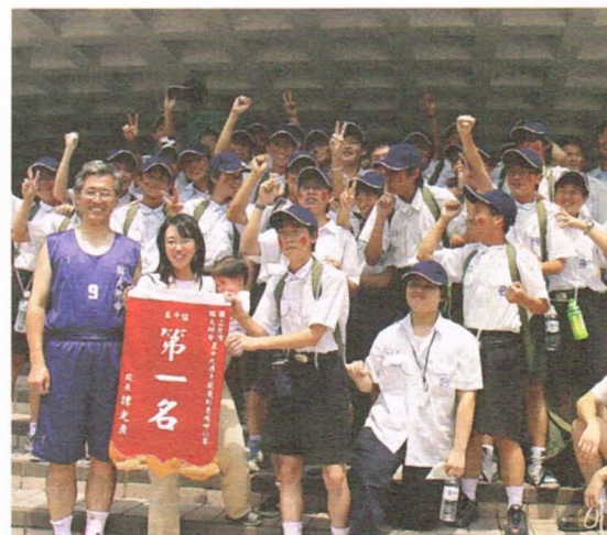
▲男子啦啦隊第一名

又到了一年一度的校慶，最有看頭的是什麼呢？無庸置疑地，當然是啦啦隊比賽！今年的啦啦隊比賽可說是別有看頭，除了傳統的啦啦隊外，還增加了時間較短但更能發揮附中人搞怪本色的創意啦啦隊呼比賽，讓男生、女生都可以依各自的專長、能力選擇參與。今年是採自由報名的方式參加，傳統啦啦都是女生班報名，而創意啦啦隊呼也剛好都是男生參加，而每班的演出都精采到讓人嘖嘖稱奇。 傳統啦啦隊由國中部打頭陣（因為長關係我們只報導高中部的部分），當國中啦啦比賽在觀眾的讚嘆聲結束後，接下來登場的當然就是最有看頭且魅力四射的高女傳統啦啦隊！首先上場的1129班以可愛的吉祥物和歡樂的舞蹈拉開序幕，接著1131班則以整齊有力的舞蹈和多變的隊形，加上一反傳統的Sexy裝扮，將全場氣氛炒熱起來！緊接在後的1132班則以街舞的形式和別出心裁的口號隊伍（中間6個女生尤其出色），將全場觀眾的注意力緊抓不放。而壓軸1133班則是以高難度技巧和整齊劃一、朝