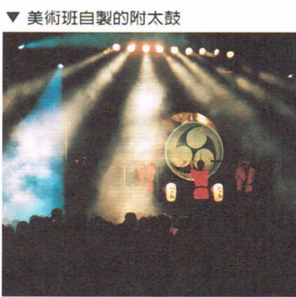
美術班自製的附太鼓