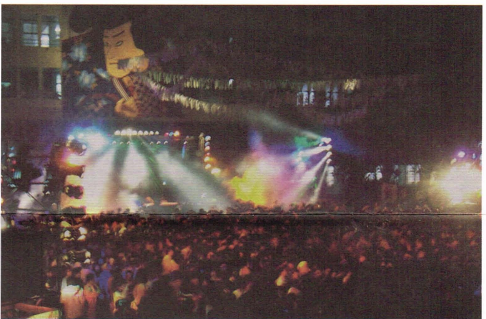
畢舞現場人山人海，熱力四射。

出現的爬牆入內或持假票入場的情況亦無發生。舞會最後於校歌聲中逐漸進入高潮，兩位新舊校長同時站臺，帶領著附子們唱一次比一次大聲的校歌，舞臺兩旁掛有高三各班班號的兩面燈籠分別閃著「HSZU」和「萬歲」等字樣。當舞池上方點燃煙火時，會場氣氛就High到了最高點。 在這次畢舞的收拾方面，除畢聯會、閃著「HSZU」和「萬歲」等字樣。當舞池上方點燃煙火時，會場氣氛就High到了最高點。