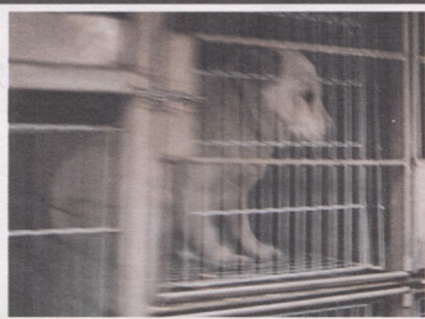
▲「熊」於日前被捕狗大隊捉走，目前已平安歸來。詳見四版