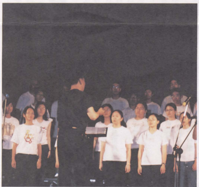
詠樂合唱團引吭高歌

在演戲方面，康輔社的串場依然還是全場的笑料，而話劇社雖然這次的主題是「藝術不再難懂」，但表演結果仍然還是讓人摸不著頭緒。另外，同樣是串場的幼幼社，在這次表演中，卻也演出讓人滿腹難解的短劇，一反常態。而這次晚會上，另一個較受矚目的，就是儀仗隊的表演，觀眾們對於儀仗高超的槍技和隊形的巧妙變化都讚不絕口；除此之外，在儀仗隊的第二表演中，隊