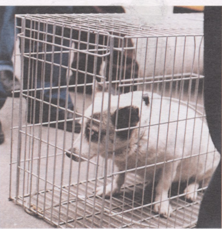
▲孤苦伶仃被囚禁在鐵籠裡的「熊」