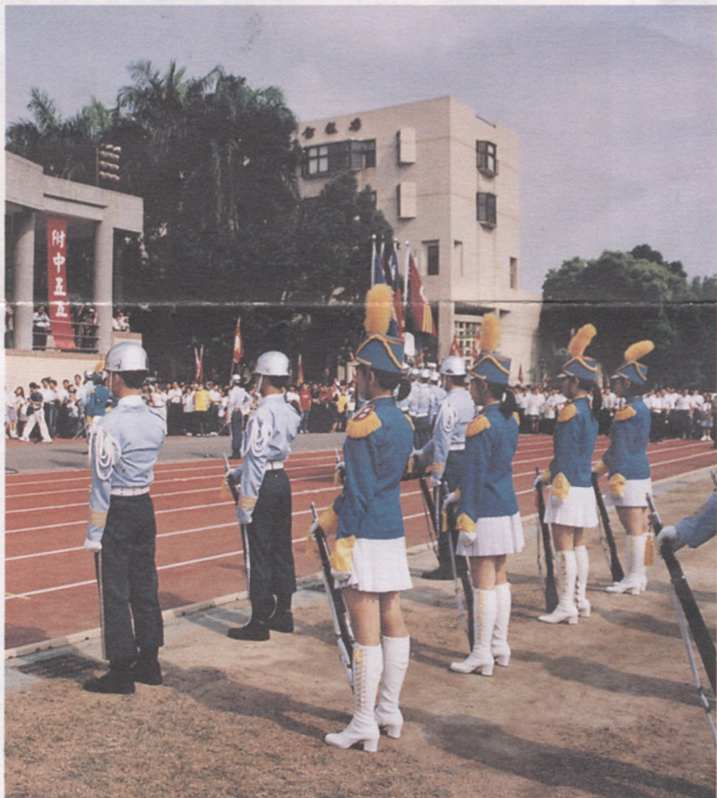
▲附中儀隊的表演為校慶開幕式增添不少光彩

〈本刊訊〉本校第五十五屆校慶在四月七日展開，這次很幸運地沒有像去年一樣天候不佳，在開幕典禮中，首先是儀隊一邊表演一邊走進操場，隨後是楊校長王孝先生，騎著一匹駿馬，帶領貴賓、校友及各班的班級代表進場。 每班各派出一名同學掌旗，站在全校隊伍的最前排，迎接校長及來賓們的進場。班代表也被打扮成最足以代表各班精神的吉祥物模樣，有人打扮成麥當勞薯條，也有人不顧天氣的炎熱，全身都被纏繞上白色繃帶，裝成埃及僵屍木乃伊的樣子。另外也有人戴上恐怖的面具，穿上黑色斗篷，手持一把鐮刀，頗有傳說中「死神」的架式。 其中也不乏些清涼的畫面，如一位男同學，穿上煽情暴露的服裝，扮成「二〇九辣妹」，充份展現出「力與美」的藝術。隊伍當中最引人注目的是一位同學坐在囚車裡被推出來「遊街示眾」，罪名是「暗戀學姊」，他還很自得地表示：「以前附中從沒有人坐在囚車裡哩！我是第一個。」但數年前的畢業典禮已有人坐過囚車，這位同學並非第一個。