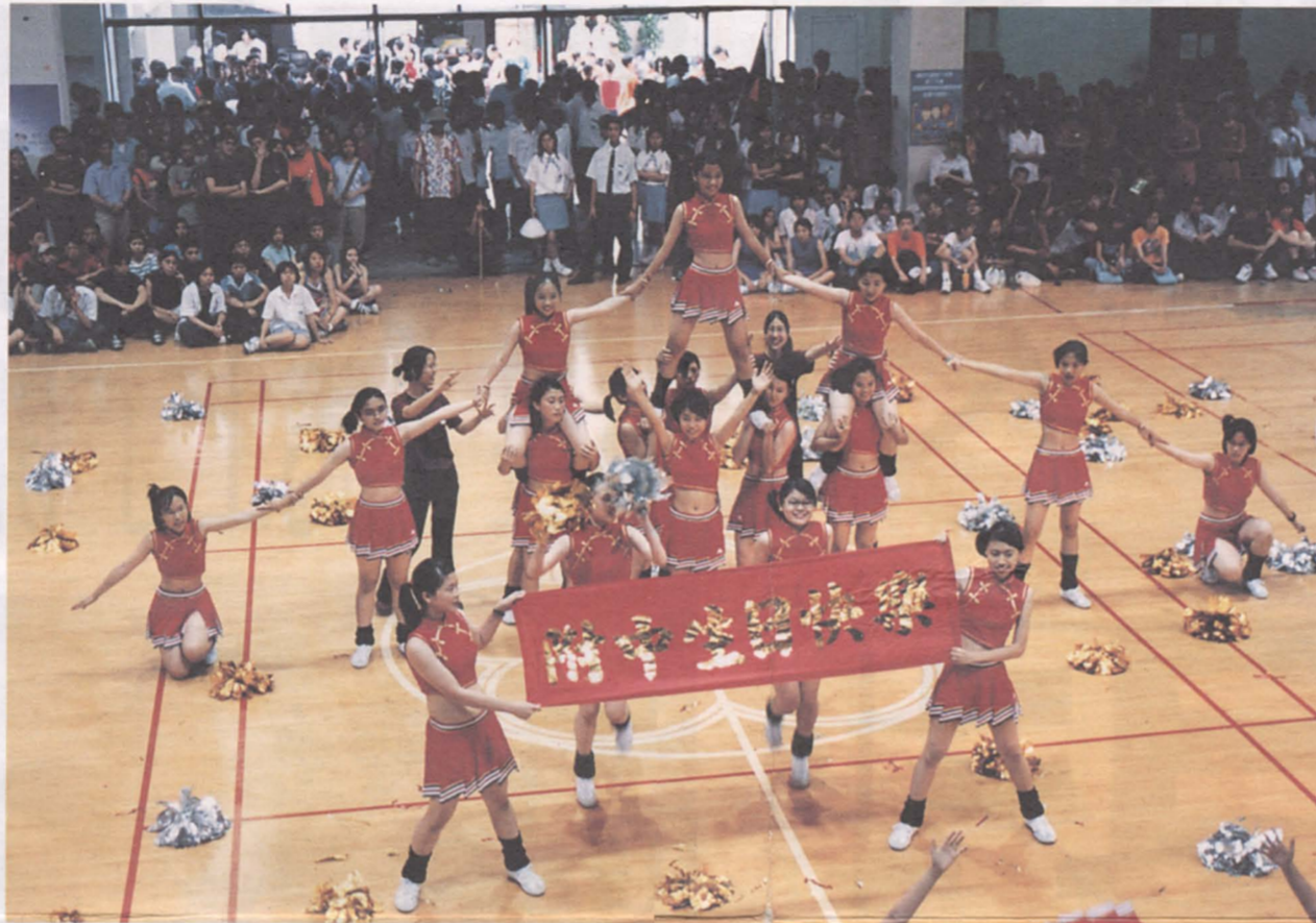
啦啦隊冠軍1021班的精彩ENDING