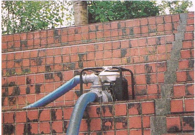
學校因淹水所購買的抽水機

除此之外，中正樓與明德樓地下室也損失慘重，中正樓水淹高度高達一百四十公分，其中影響最大的莫過於在中正樓的社團辦公室，社團中的漫畫、器具幾乎是付之一炬。明德樓地下室雖只淹五十公分，但會議室中的電腦與錄影帶因此而泡湯了，諮商室中的地板也因泡水而受損，中正樓與明德樓地下室的總損失，不亞於泡水最嚴重的新北樓。