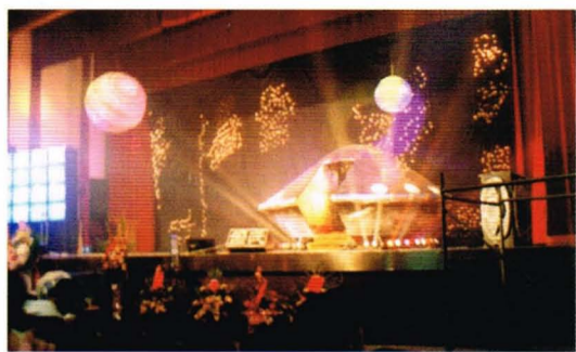
48屆外太空畢業典禮

第48屆畢業典的主題是外太空，由推甄上榜的同學辛苦製成。台上以假亂真的太空船中，走出身著太空裝的主持人，全場歡聲雷動。胡天爵指出，本屆最大的特色就是舞台佈景，把國父遺像和國旗拿下，換上具有太空感的太空艙，另類的創意傲視全國高中畢業典。