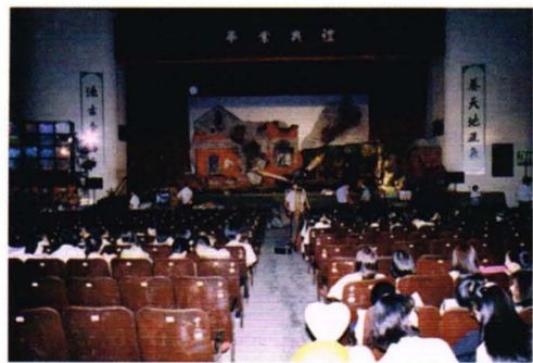
▲圖中可見尚未改建前的中興堂

最後師長們上台合唱「愛的真諦」，畢業生代表以繞舌歌和雙簧的方式代表畢業生致詞，俏皮中充滿著不捨和濃濃的附中情。最後以「我來自附中，我是附中人。」劃下句點。這樣的畢業典禮讓畢業生們擁有一個永生難忘的美好回憶。