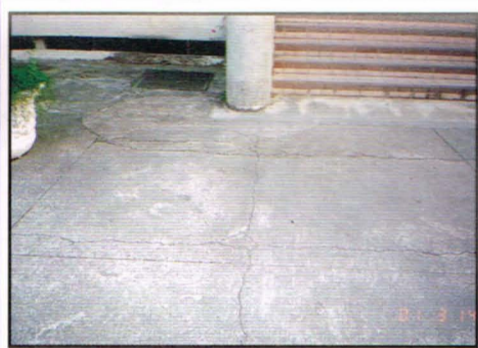
▲中正樓與新北樓間走道因水泥地板出現裂痕將整修

【本刊訊】圖書館在園遊會當天，於閱覽室(二)舉辦舊書展，這項活動持續了一個禮拜，給每班圖書股長與教職員們登記來索取舊書。 在圖書館供索取的書，主要是在圖書館儲藏室中堆藏的舊書，這些書大部分是圖書館藏有副本或學校不需要擺放的書。舉辦這次書展，目的是為了將這些圖書出清，並給一些需要的老師或同學們，一來可以擴充每班的班級書庫，也可將不需要的圖書出清，讓每一本書的價值發揮到極至。 這次書展的舊書，許多是超過二、三十年的絕版書，但目前都有內容更豐富的新版，這些舊書價值自然不那麼重要，圖書館現在正努力蒐集的是附中自己出版的刊物，許多早期的附中青年在圖書館至今都找不到，這些特屬附中的刊物，才是目前圖書館急需收藏的。 (記者/許師倫)