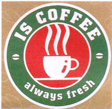
▲ IS COFFEE 的標誌

各分店的促銷方式都有些許不同，以台北復興店來說，咖啡外帶打八折，續杯半價，點飯類餐點加飲料半價，早餐供應是在 10:30 前，營業時間由早上 7:30 到晚上 12:00，若想知道最近一處的 KOHIKAN 位置，可上網查詢： http://www.kohikan.com