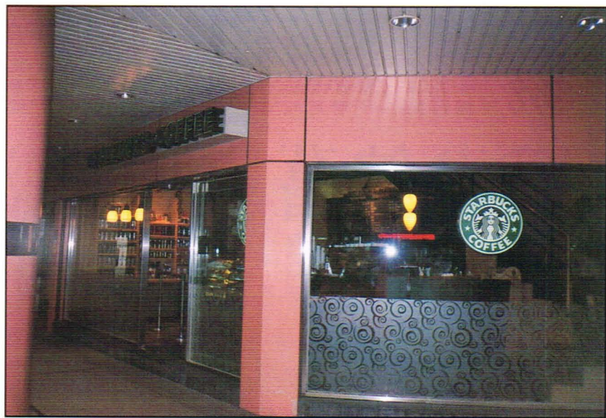
▶ 附中附近的星巴克咖啡

丹堤咖啡是國內第一大平價咖啡店，也是目前國內直銷店數和加盟店數最多的連鎖咖啡店。「薄利多銷」是丹堤咖啡的經營理念，只要花三十五元就可以享受一杯丹堤咖啡了。