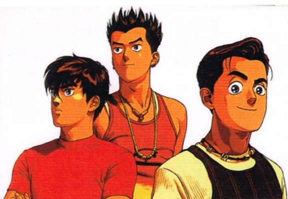
YOUNG GUNS 林政德／尖端出版

可惜的是畫家林政德因特殊因素，目前已沒有在連載續集，只出版到第十集，不過畫家林政德尚有許多著作，像是哪吒、林政德漫畫作品集：等等，也都是不錯的選擇。