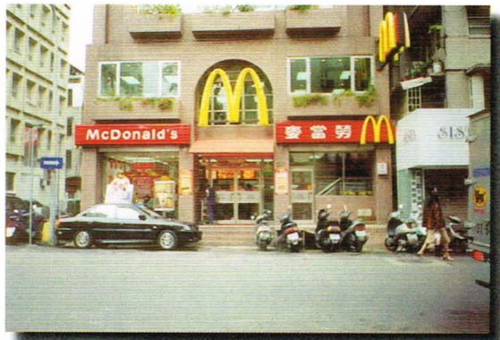
▼ 大安路上的麥當勞

「外帶全家餐」是由肯德基首創，並帶動風潮的，肯德基的主要商品爲炸雞，以鮮嫩多汁爲訴求，深受大家喜愛，是速食店中炸雞的最佳選擇。另外肯德基也和其他速食店一樣，有一些贈品活動，如最近的買套餐加一百二十三元，就可得到哆啦A夢的收音機，可增加大眾對肯德基更多的興趣。