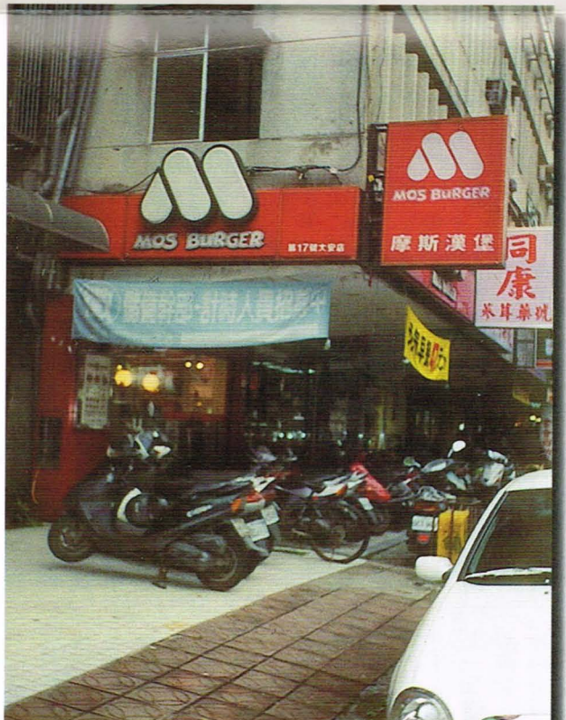
▲ 來自日本的摩斯漢堡

成立於一九八○年的 Mos Burger 摩斯漢堡來自日本，創新的米漢堡，透明的製作過程和親切的服務，更是在速食業界大放異彩。不同於一般美式漢堡，Mos 獨家研製的米漢堡特別受到顧客們的青睞，將米飯經過特別處理，無論是挾著美味的肉片或芝麻牛蒡，都令人垂涎欲滴。此外，Mos 以東方口味配方調製，改變漢堡的組合，並加上大量的生菜，兼顧營養和健康。自稱擁有全台灣第一添加墨西哥辣椒的辣味漢堡，辣中帶甘的好滋味也是一絕。