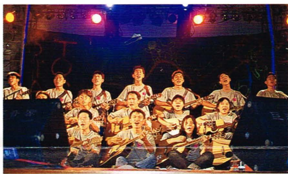
高一一大合唱——紅蜻蜓

社，在中興堂搭了一座大銀幕，播放著自己拍攝的VCR。場內外並擺設了許多電影看板，十足地符合他們「影展」的名稱。表演的節目都是他們精心設計的，像是由高一擔綱的「螢光劇」、挑逗人心的激情脫衣秀，及代表作「教官」。中場並有其他學校的友社上台祝賀獻禮。 吉他、管樂、康輔三社成果展所用的節目單、廣告、廠商聯繫、節目設計等工作，都是由同學們自己負責的，表現出這些同學能擔大任的一面，在曲終人散後，別忘了給這些辛苦的同學們敲鼓掌。(記者/陳文政)