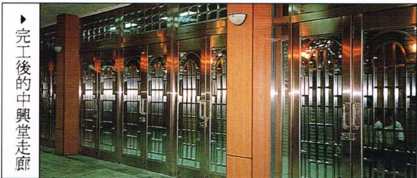
完工後的中興堂走廊

〈本刊訊〉在中興堂終於完成整修，提供大家的是更好的音效、現場及視覺效果。而西樓則離完工尚有距離！東樓則考慮將中正樓處室搬到那裡，高二不用和高三搶新北的教室。 中興堂在民國五十九年建成時，內部設有籃框做為學生生活動場所，集會時再用「人工」擺設椅子。後來因為漏水問題嚴重，在民國七十六年進行第一次整修，屋頂用柏油重新鋪設；加裝固定式的紅絨座椅，把中興堂改頭換面成禮堂的模樣。