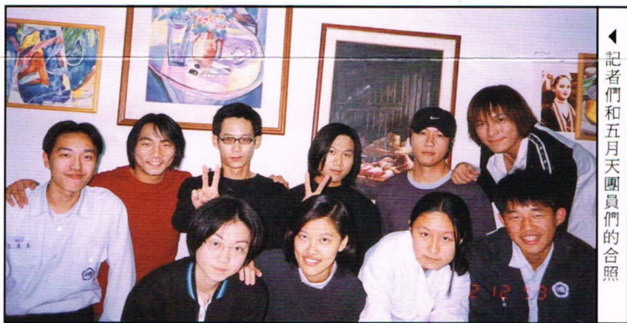
記者們和五月天團員們的合照

信：這是很重要的，並不是嘴巴唱出來的才叫創作。在我們表演時大家可以聽見主歌、樂器，像鼓啊、貝斯、吉他都一樣大聲的，那每一個聲音的出現都是創作，因為每一個聲音都可讓我唱的歌變好聽，所以這張專輯應該說是我們一起創作的。 孟：有些人會認為：軋車和 Ho Ho Ho 會帶給學生不良的影響，那是在什麼樣的情況下作出這些歌？ 信：我覺得我們的歌並沒有說要鼓勵大家的意思，只是一種敘事的感覺，沒有什麼正反的評價在歌裡。其實是你想到什麼感覺的就是什麼感覺，我想呈現的就是這種感覺。 孟：是想要呈現什麼樣的感覺才會寫出匠的歌詞呢？ 信：聽過的人不一定要真的去聽。