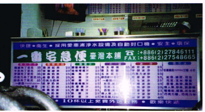
傑駿王、軒浩黃／編執

品，分辨的方法，就是看杯上的手寫，但有時會模糊不清，如果杯子透明，就容易分辨了。老闆亦表示等到一切有了一定的成績，或許會將某天的所得捐給慈善機構。對於旁邊就有一間競爭者，老闆只希望能與對方和平相處，畢竟大家都是同業嘛。(九四八·魏繪君)