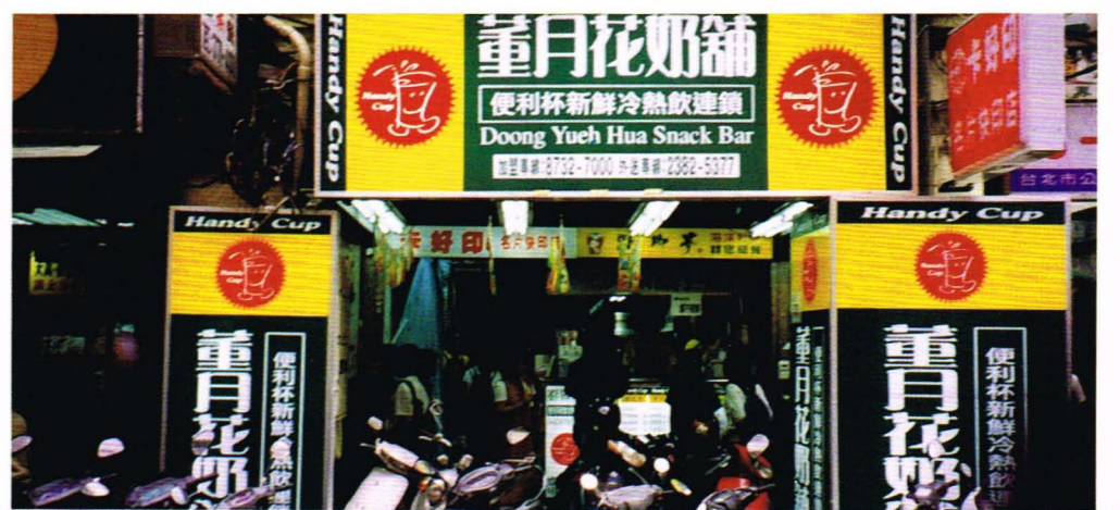
位於台北火車站附近的董月花奶舖，紅、黃、綠三色相間的招牌吸引路人的注意。

光是一種飲料，店長就滔滔不絕地講了一段時間，聽了記者心裡不禁萬分佩服，但是，到底不是真的，就請各位當當看啦！ 到此消費的，大多是以學生及上班族為主，而這間店也有長期光顧的老客戶，而為了照顧這些人，也實有一折價券，但只限於點飲料內用的情況。在此記者要奉勸各位，飲料內用與外用的差別，可能有一點「令人無法接受」，但是有些人並不在乎，因為店內的燈光相當柔和，氣氛也不錯，所以座位也常常滿的，而店長也特別讓出了一桌讓記者感受一下，感覺滿好的，但是多了一點分秒，感覺就變了差一點，不過整體感覺算是不錯的，各位也可以去感覺一下，至於價錢方面，記者感到「不太便宜」。 經過了二十到三十分鐘的採訪之後，店長滿臉笑容的送走了我們這群「不速之客」，記者本身雖然沒有消費，但也感到了「賓至如歸」的感覺，這間店的服務態度真是的很棒，很少人不會不陪入這種「溫柔的陷阱」裡，也是這家店自開店以來的三年多歲月裡，生意始終都是這麼的興隆原因，當然他們東西的品質也是相當地好。(九五七·王駿傑)