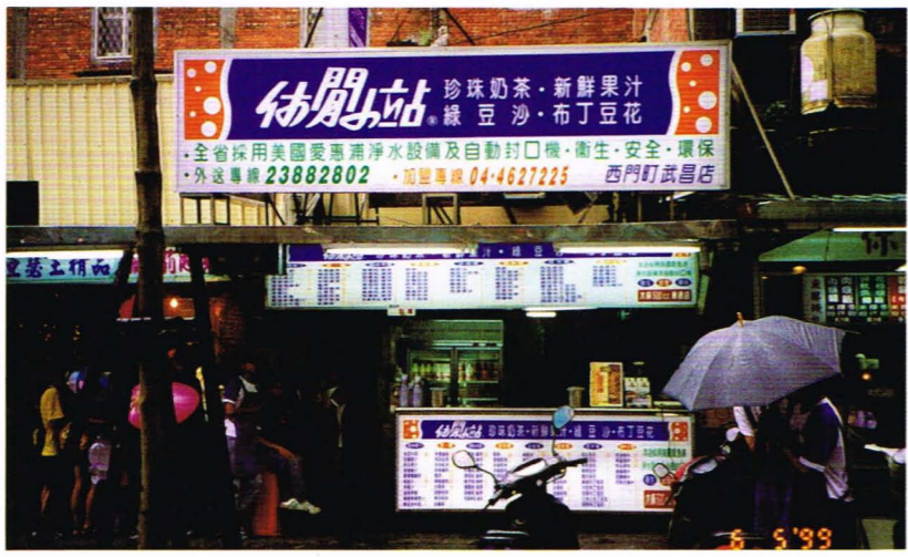
座落在西門町的休閒小站，漂亮的店面讓人耳目一新。

就是訂購的活動是由總公司執行，價錢的多寡也由公司和廠商決定，店家無法干預。 最後是銷售重點。在這方面，陳老闆認為沒有什麼花招或技巧，最重要的是要把顧客當成好朋友，彼此沒有隔閡，如此才能與客人建立良好的關係，而至於價錢的多或少則是其次的問題。以上就是陳老闆回答記者問題的大概內容。 在炎炎的夏日裡，喝一口濃濃甜甜的珍珠奶茶，含一口沁人心脾的冰沙，或者在寒冬裡，一杯熱熱的薑茶入肚，都能讓人留下或冰、或熱、唇齒留香的美好回憶，而對於這些美味與口味的需求，皆能在一家500cc 飲料店中得到滿足。(九四四·黃浩軒)