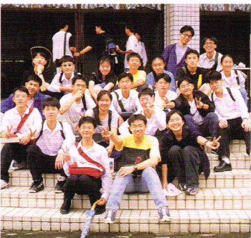
口琴社於比賽後在興雅國中團體合照