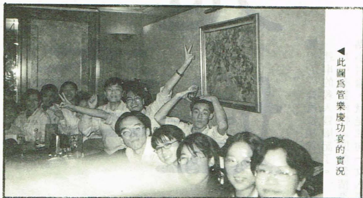
此圖為管樂慶功宴的實況

我們敬愛的教練說：「成功絕非偶然，但不是僥倖。」所以我們所有的隊員，都以今年三月份的省賽為目標，希望能在省賽中大放異彩，勇奪第一。附中，不要做永遠的第二名。