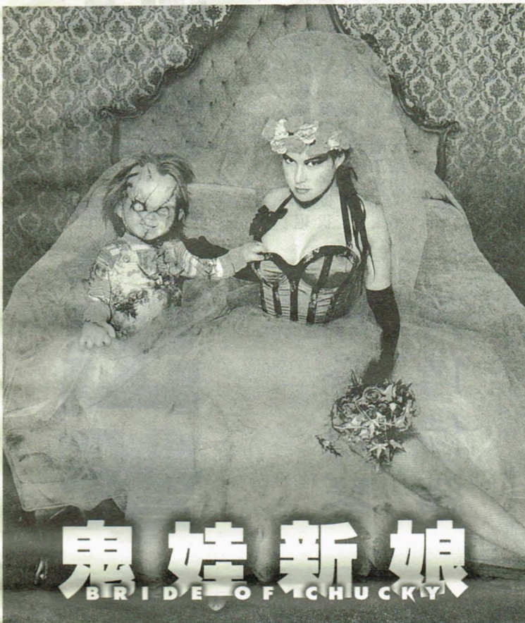
鬼娃新娘 BRIDE OF CHUCKY

前三集的恰奇，是個拿著藍波刀，四處去殺人的魔鬼娃娃，稱的上是真正的殺人鬼故事，令人驚心駭目。殺人的手段新奇血腥，頗能滿足尋求刺激的觀眾。而這集，出現的殺人方法都不是瞬間死去，之間都會有段絕望與害怕的表情，讓觀眾有好像身如其境的恐懼，甚至不時發出驚叫聲，更能增加電影院內的氣氛。 這集的大意是說恰奇死亡前的女朋友蒂蒂妮，找到恰奇生前的魔法書，並依書上的做法，使恰奇復活，只是，她知道恰奇並不想娶她後，也來不及了，終於遭到了恰奇的報復，並也被變成了娃娃。兩「人」為了重回肉身，決定去恰奇的墳墓，以利用黏