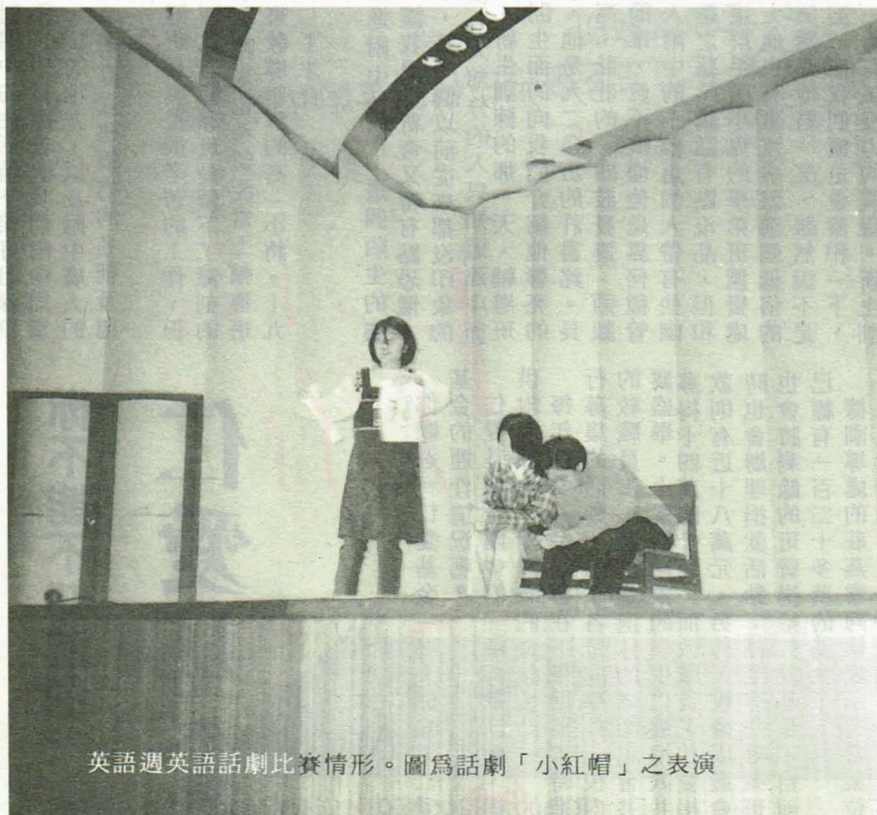
英語週英語話劇比賽情形。圖為話劇「小紅帽」之表演

戲劇的表現更為出色。在「美好的一天」一劇中，演員不僅因劇情需要而做了最忠實的打扮，而且，佈景道具轉換迅速熟練，能在眾多參賽隊伍奪魁，不是沒道理的。