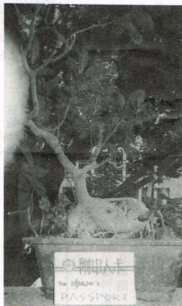
之面封「卡人中附」為圖此▲草圖

〈本刊訊〉此學期本校將在社團活動方面有一重大突破，即為社團護照的出現。據聞，台灣地區，有部分高中採五育榮譽記錄卡方式記載學生活動狀況，但是根據教育部的規定，第一所具有社團護照的高中，則為師大附中。本校的社團護照不僅精美，且希望能真實的記錄每一位附子在社團參與活動的情形，成為日後參加大學推薦甄試時的重要參考資料。