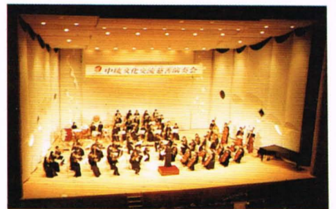
本校音樂班於寒假期至琉球巡迴演出

比賽及校慶晚會等一系列活動於校慶當週內陸續舉辦。 今年校慶活動的大致日程如下：四月十日星期三為校慶日，放假一天；第五屆迷你馬拉松比賽於四月十二日星期五下午舉行；星期六下午則有拉拉隊比賽，晚上於中興堂有由本校同學、社團負責的校慶晚會；四月十四日則是校慶園遊會。 今年園遊會的地點原本決定在大操場，但由於目前正在保養草皮而無法使用，所以決定在新舊北樓中間、排、網球場及舊北樓北側。園遊會的設施則是以班級為單位。有關人員表示：前年的園遊會就是以班級及社團為單位，結果有老師反映，班上的同學班級及社團兩頭跑無法兼顧，今年便以班級為單位舉辦。另外在校慶當天早上有全國大學附中校友籃、排、壘球賽。 據有關人員表示：今年活動如此辦理，為了使同學不會因活動太過集中而勞累，所以今年將各項活動盡量錯開，如校慶園遊會及迷你馬拉松比賽即錯開，以避免同學兩頭奔波，太過勞累。