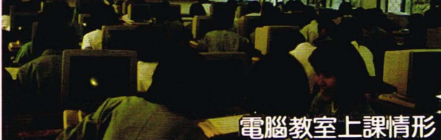
電腦教室上課情形