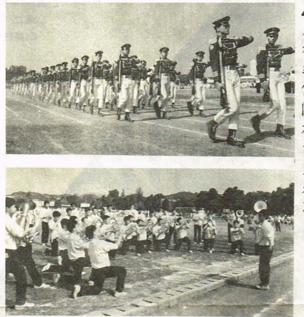
本校樂儀隊於台大表演

【本刊訊】新北樓工程興建結束後，學校又將再為同學們建造一個新的建築——音樂館。 這幢建築物已於數週前開始施工，地點包括原來的戰技場。預定建造的音樂館共五層，裏面有新的音樂教室、練琴室和許多可供同學練習的空間。至於地下室則預備做停車場、腳踏車的地方，今後汽機車將不再擺置於車棚，音樂館可為全體同學使用，並不因修習科目不同而有所限制。至於舊音樂教室，則在音樂館起用之後，將當做運動場地。 音樂館完成之後，對於演奏者及欣賞者，都是一大福音。為了日後的享受，我們有必要忍受目前施工的不便，希望同學們能夠多加體諒。 【本刊訊】為了解決本校舊居生的住宿問題，舊北樓二樓的宿舍改裝工作，目前正接近完成。 早在數個月前，改裝工作就已展開。整建完成的宿舍，內部設備包括衛浴設備，五人用的衣櫃三十個，雙人床共四十五張，另外，宿舍的隔間、整修、紗窗紗門的加裝等一切費用，約花費一百萬元。至於插座，學校為了方便管理，將不在房間內安置插座，在室內也不放書桌。住宿舍的同學，放學之後，一律在圖書館閱覽室唸書，作息的時間，學校將另外規定。 扣掉管理員住的一個房間，宿舍還有十五間，一間可住十人，總共可住一百五十位同學。學校於五月中旬將開放給同學參觀，有意者請於抽空前住參觀。據稱一年二個學期費用只收一千八百元，以減輕同學負擔。 至於正式的登記申請日期，以及其他規定，將於適當時間公佈，請同學們留意。