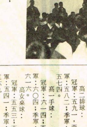
演講會場，同學反應熱烈。