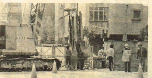
正在施工中的信義路

【這兒原是一大片水田，幾間低矮的瓦房。不像現在，到處是高樓大廈，一大堆人全擠在一堆！」 我了解爺爺的感慨。心中悶悶地想著：「或許有一天，我必須向下一代解釋那被擠