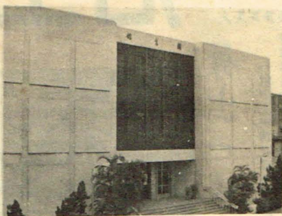
地場覽展座講書圖